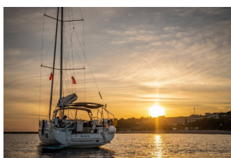
OCEANIS 46.1 - layout 4 CABINS & 2 HEADS